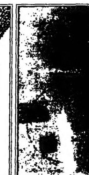
اللوحة الخشبية التي أصبحت غلافاً